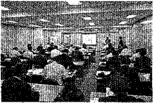
写真は説明会の模様

CLV21大阪の出展者説明会が全国クリーニング会館で行われ、大会規模や併催企画などの概要が発表された。それに伴って、9月18日時点の大会規模として「出展59団体・社190小間(前回大会は108団体・社232小間)となった。